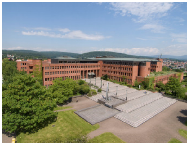
Landratsamt, Am Kreishaus 1-5, 65719 Hofheim

Sie möchten mehr über Themen des Kreises wissen?