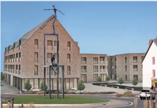
Hannes Helmke – Balanceur und Sitzender auf großem Stuhl, 2014 Bronze, h = 600 cm, www.hannes-helmke.com

Stefan Rohrer begeisterte im Jahr 2017 während der Skulpturenbiennale Blickachsen 11 in Eschborn mit seinen Skulpturen, die aus Karosserien von Autos und Motorrollern entstehen.