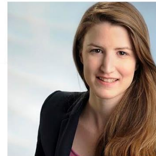
Inga Freund Fördermittelberatung