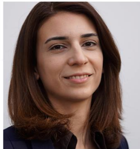
Cigdem Yalcin Fördermittelberatung