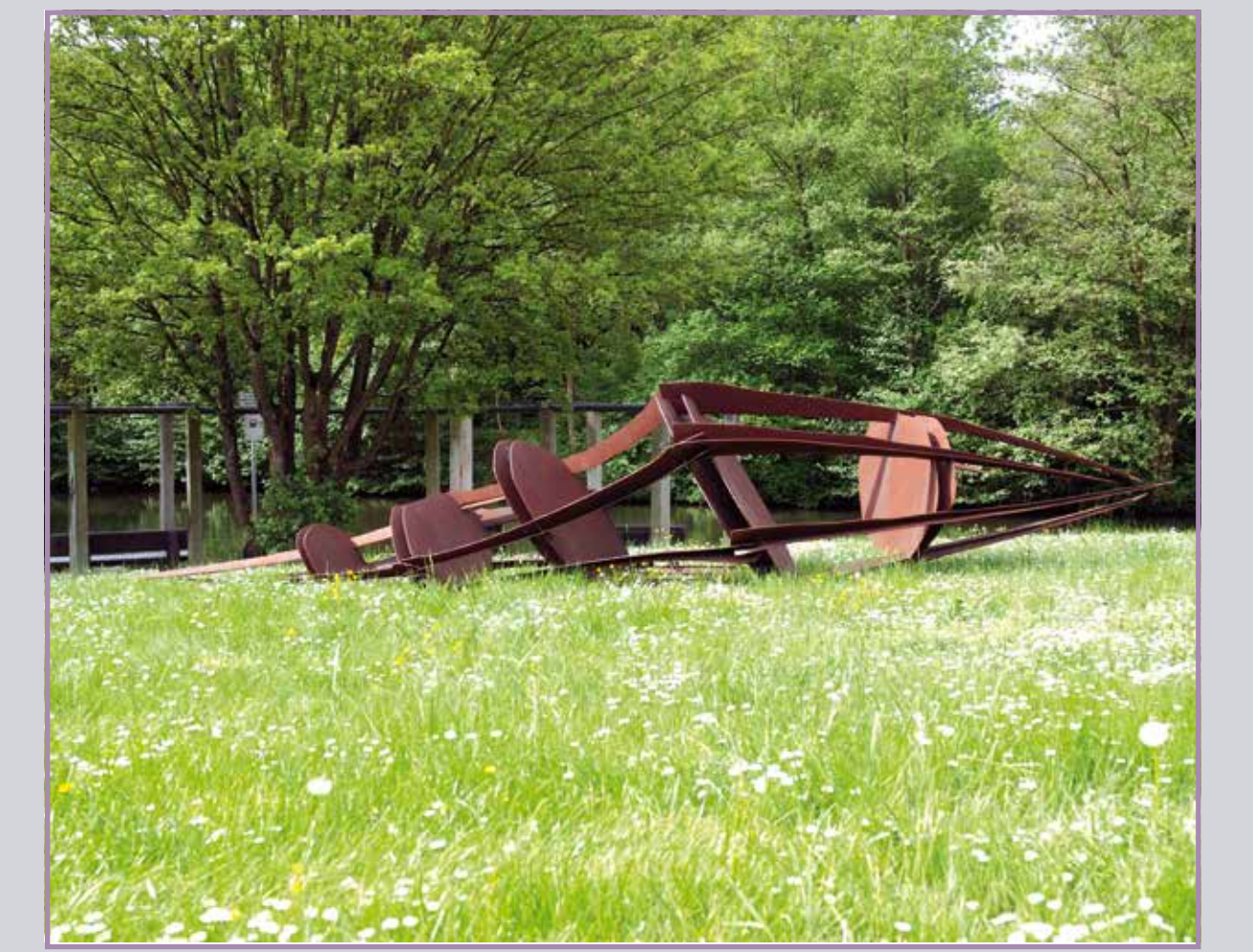
● Hybrisruhe 2000, Stahl