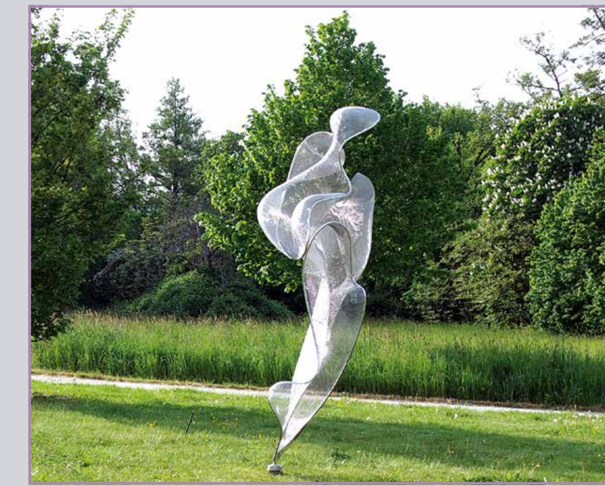
● Inside 2015, Edelstahl