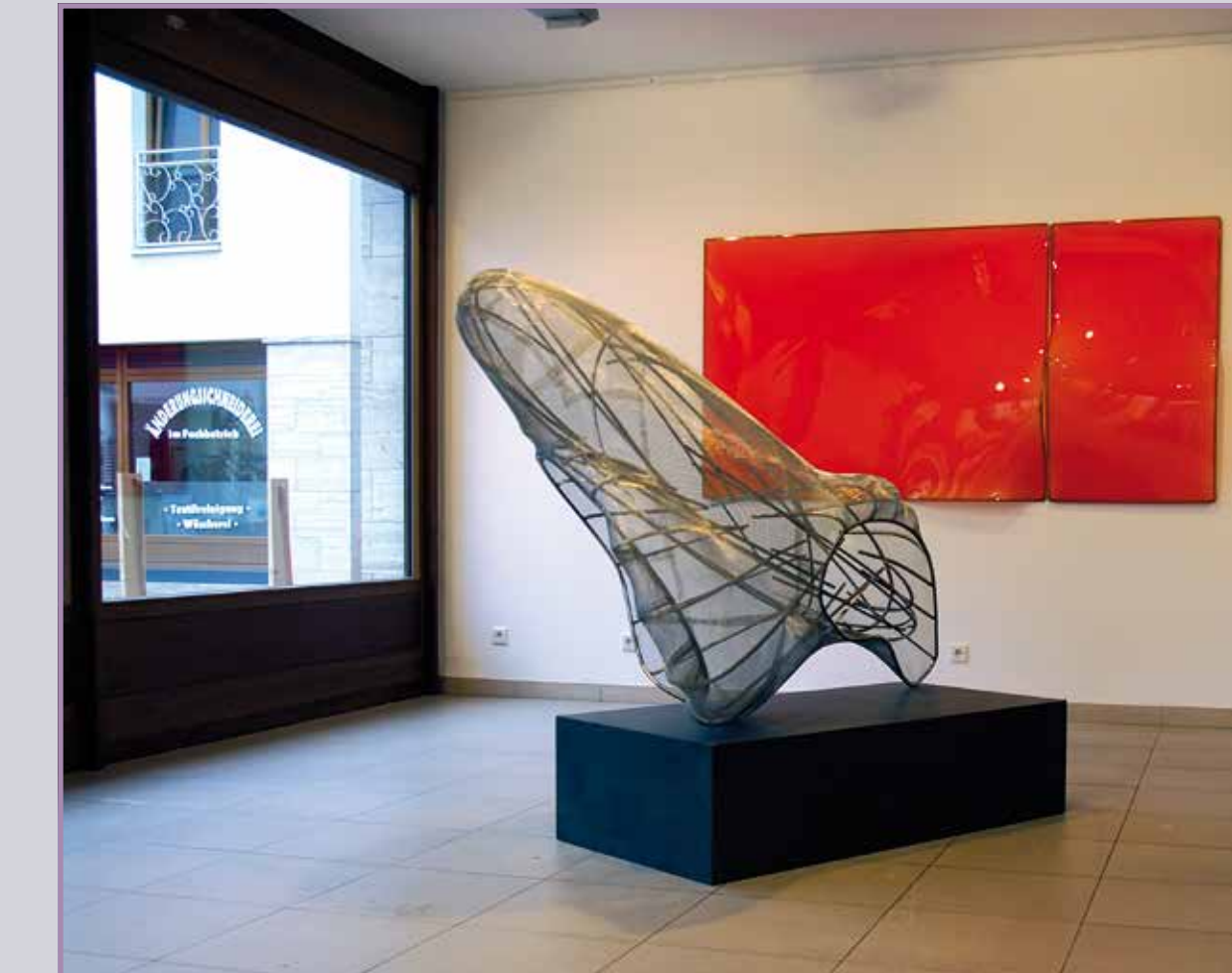
● Nuova Form 2011, Edelstahl