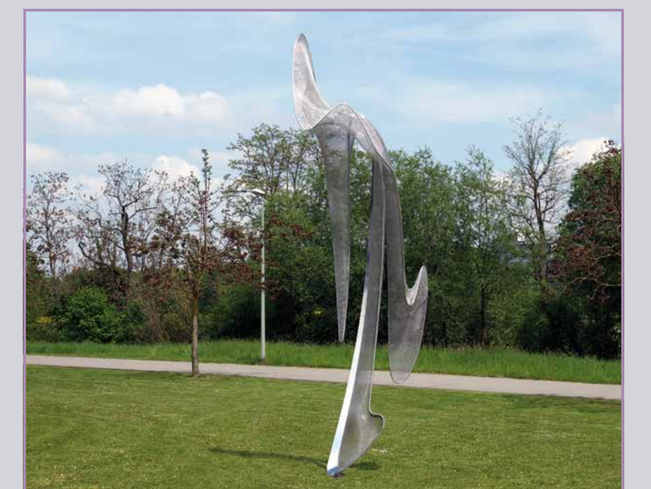
● Phos 2013, Edelstahl

www.eschborn.de Skulpturenachse, rechter QR-Code