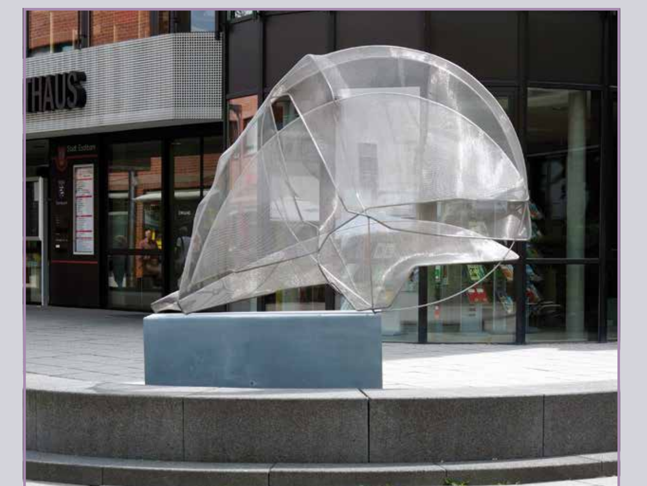
● Land 2008, Edelstahl