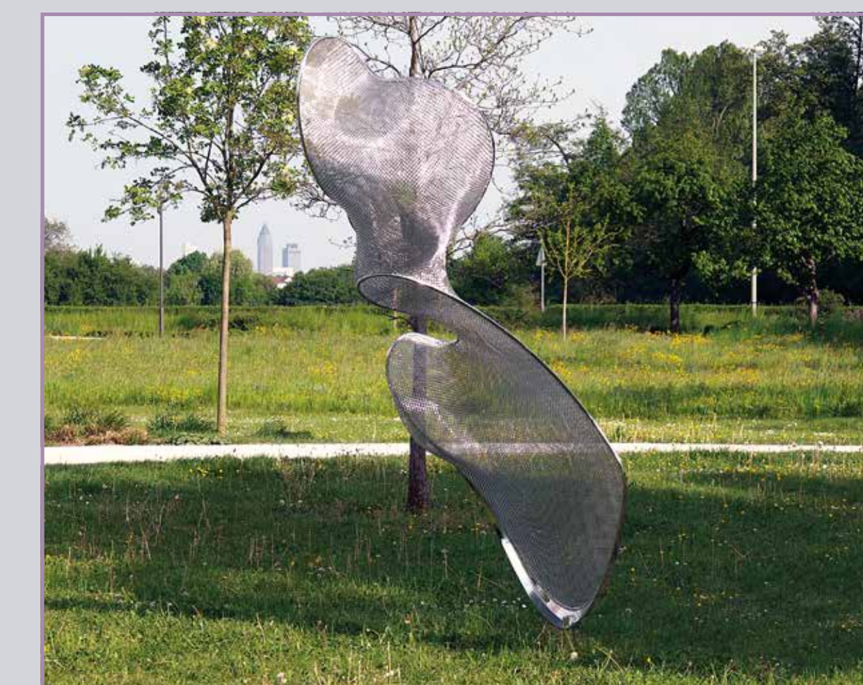
● Windsbraut 2015, Edelstahl