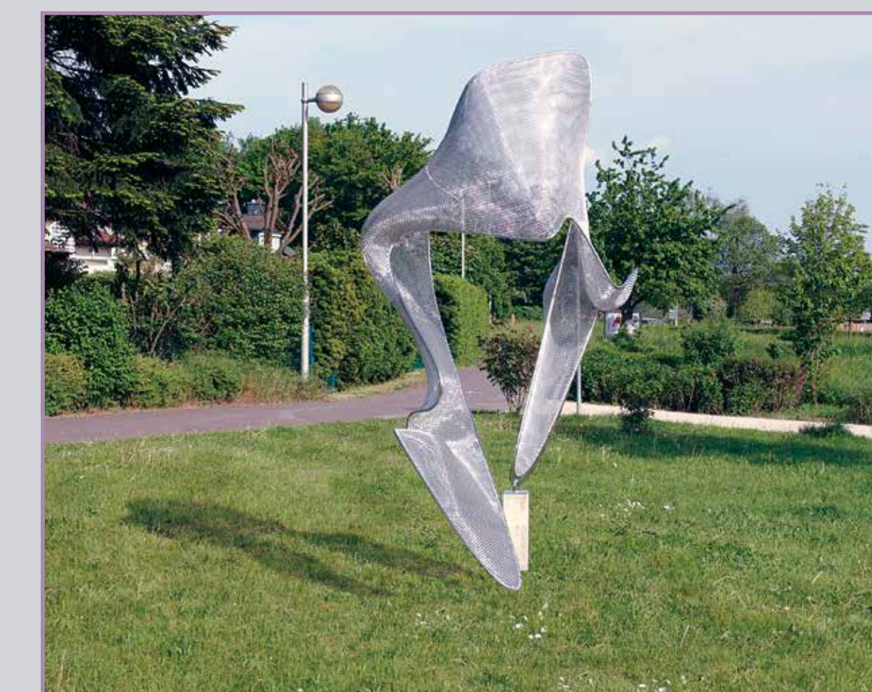
● Mooka 2#3 2016, Edelstahl