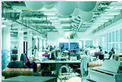
Tech Quartier in Frankfurt