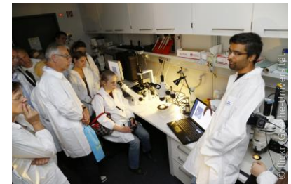
Campus de Ciencias