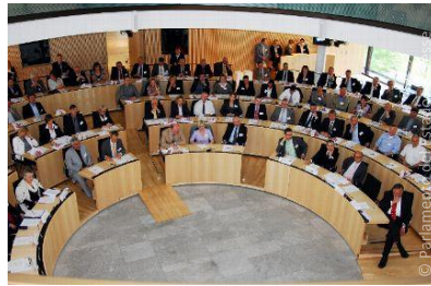
Parlamento del Estado de Hesse