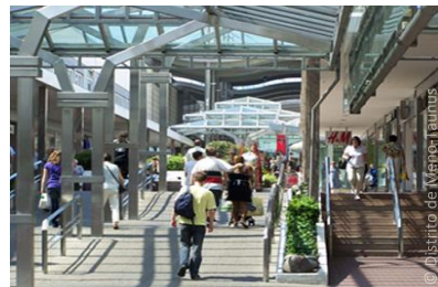
Centro comercial MTZ