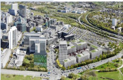
Zonas industriales Eschborn