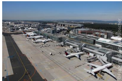
Aeropuerto de Fráncfort