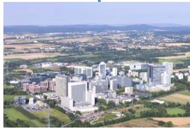
Polígono industrial Sur