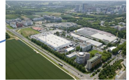
Polígono industrial este