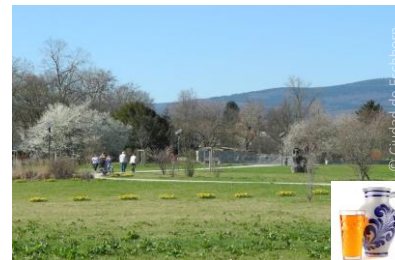
Vistas al Taunus