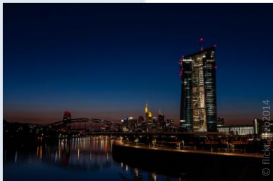
BCE frente a Skyline