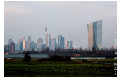
Banco Central Europeo (BCE)