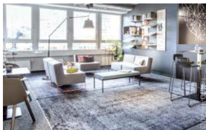
Espace de coworking à Eschborn