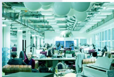
Tech Quartier à Francfort