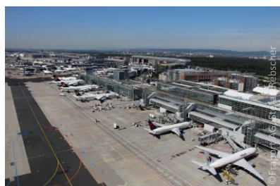
Aéroport de Francfort