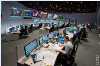
ESA - Centre de contrôle