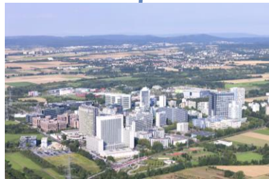
Zone industrielle sud