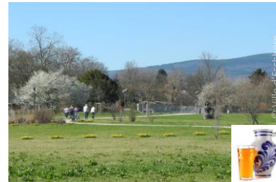
Vue sur le Taunus