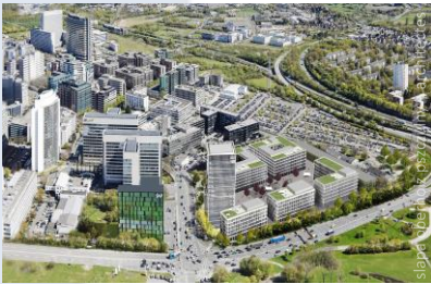
Zones industrielles Eschborn