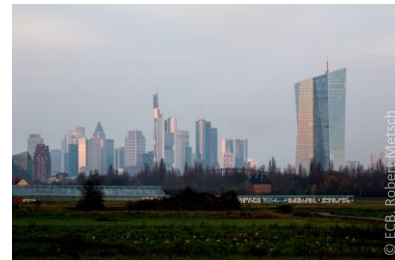
Banque centrale européenne (BCE)