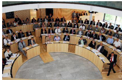
Parlement du Land de Hesse