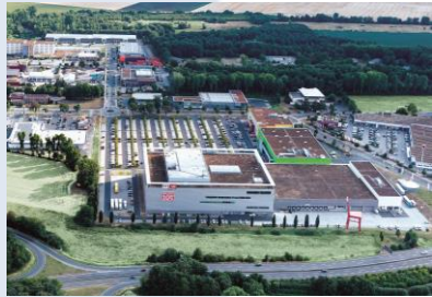
Parc du Camp Phénix