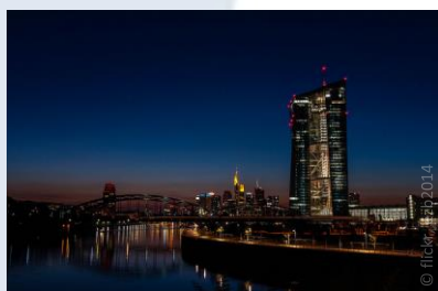
BCE devant le skyline