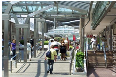
Centre commercial MTZ