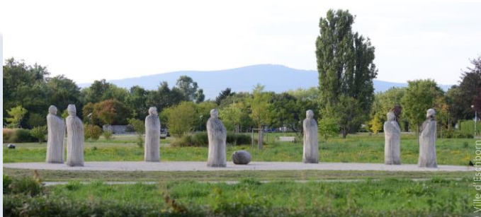
Parc de sculptures de Niederhöchstadt